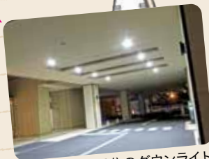
ロータリー部分のダウンライト

ご不便をおかけして申し訳ありませんでした。 北側出入口から正面玄関に至る植え込み部分の 照明を1つおきに点灯し、出入口の看板、 出入口の電灯か所、正面玄関外の ロータリー部分のダウンライト8か所を 日没から日の出まで点灯しています。